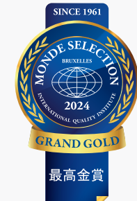
Grand Gold Award

CN: 金奖 DE: Gold vergeben ES: Oro premio FR: Label Or JP: 金賞 KO: 금상 PT: Ouro prêmio TW: 金獎